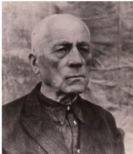
Teofilius Matulionis Mordovijoje 1955 m.

Pasaulis keičiasi didžiuliu greičiu. Gyvenimas kinta. Labiausiai jo materialinė kiekybinė pusė. Tačiau netrunkame pastebėti, kad kokybiškai ir vertybiškai daug kur menkstame ir degraduojame. Vartotojiškumas, konformizmas, kasdienis patogumas gali virsti ir virsta dvasiniu apsileidimu ir netgi tinginyse. Kol gyvename žemėje, kol keliaujame šitą kelionę, iššūkiai ne tik neišvengiami, bet ir labai reikalingi: ir kiekvienam iš mūsų individualiai, ir mums kaip šeimai, ir kaip bendruomenei. Tačiau šiuose iššūkiuose niekada nesame vieni. Jeigu esame, tai tik todėl, kad patys apsisprendėme tokiais būti, nes netgi tose situacijose, kur, kai mums labiausiai reikia, šalia nėra kito žmogaus, visada yra Dievas, jeigu leidžiame Jam būti. Išdrįsti, išmokti ieškoti ir paprašyti pagalbos reikia nuolankumo, reikia išdrįsti būti priklausomu nuo kito: nuo žmogaus ir nuo Dievo. Pasidavę puikybei ar savojo įvaizdžio – asmeninio ar bendruomeninio – kūrimui, nesame tiesoje. Čia padarome pirmąjį klaidą meluodami sau ir kitiems. Tokiu būdu tampame nelaisvi. Nesvarbu, kad ant rankų ir kojų nesimato uždėtų regimų grandinių.