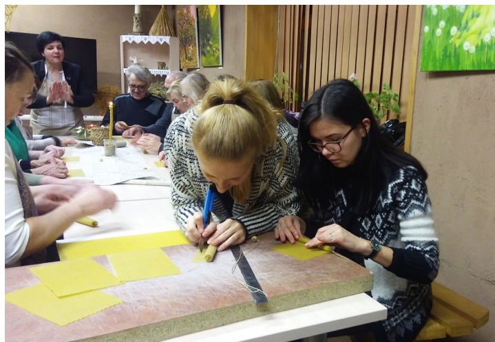
Įtraukiantis Grabnyčių žvakių gaminimo procesas Upytės tradicinių amatų centre

Po posėdžio visi, kas galėjo, važiavo į Upytės tradicinių amatų centrą, kur patys gaminosi Grabnyčių žvakes, prisijungę prie folkloro ansamblio „Upytės Vešeta“ repeticijos šoko ir kartu dainavo. Visi linksmai praleido laiką ir su didžiausiais išpūdziais grįžo namo. O vasario 2 d. Grabnyčioms į bažnyčią atvyko ne su pirktomis žvakėmis, bet su savo pasigamintomis tą linksmą ketvirtadienio vakarą.