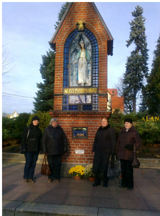
Prie Švč. Mergelės Marijos Apsireiškimo vietos Lenkijoje

Pirmoji mūsų aplankyta bažnyčia buvo Studzieniczoje. Čia pat, saloje koplyčia su Marijos su kūdikiu paveikslu. Vietovė žymi tuo, kad yra stebuklingas šulinys, iš kurio vandenį gėrė pirmieji kapuciniai, atklydę į šią ežero salą slėpdamiesi nuo persekiotojų, čia mėgo lankytis popiežius Jonas Paulius II, kurio palinkusi skulptūra ant ežero kranto, tarsi laimino mus ir kvietė kalbėti Rožinį. Sukalbėjus Rožinį visus mus apėmė tokia vidinė ramybė, kad atitrūkome nuo kasdieniškų rūpesčių, kilo noras apkabinti visą pasaulį.